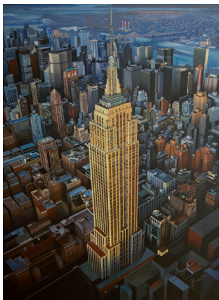
Empire State Building, Acryl